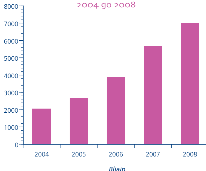
Méadú i Líon na nDaltaí Núíosacha 2004 go 2008